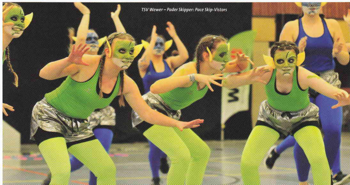
TSV Wewer – Pader Skipper: Pace Skip-Vistors