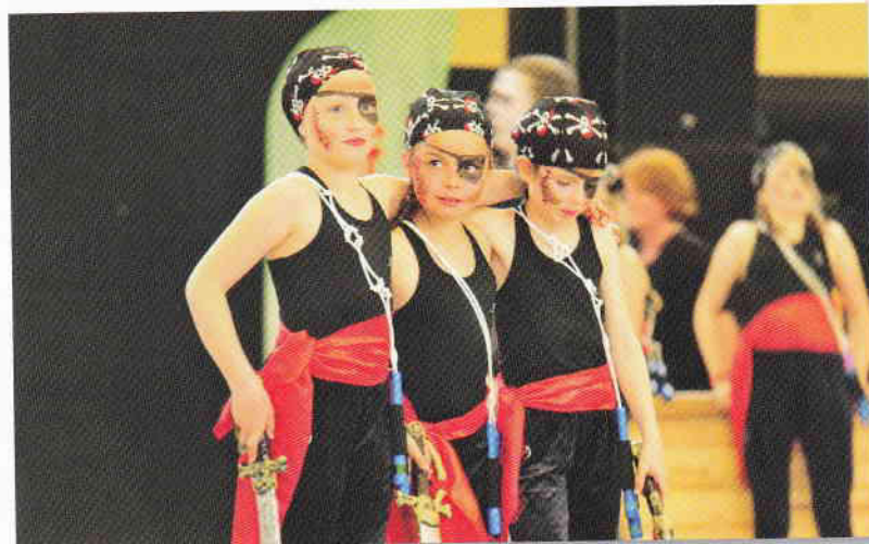
TSV Wewer – Pader Kangoos: Piraten – die Wilde 13