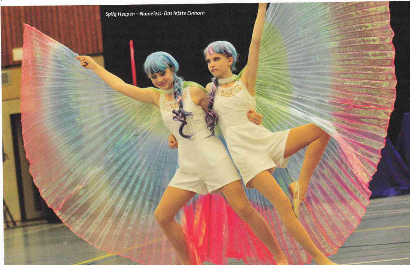
SpVg Heepen – Nameless: Das letzte Einhorn

dem kann ich mich nur anschließen. Die Fehler, von denen die Wallabys im Interview berichteten, wurden von uns Tuju-Reportern nicht bemerkt. Das Bühnenbild und die Kostüme wurden sorgfältig auf das Thema Vogelnest angepasst, was sogar von der Gruppe, mit etwas Hilfe der Trainer, selbst entwickelt wurde. Unglaubliche acht Monate arbeiteten die 26 Mitglieder an der Aufführung. Sie probten diese bis aufs kleinste Detail und es zahlte sich aus; ein sehr guter